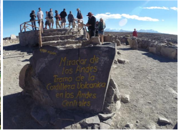
Höchster Aussichtspunkt Südamerikas: Mirador de los Andes

Busfahrt von Arequipa nach Chivay 163 km (3h)