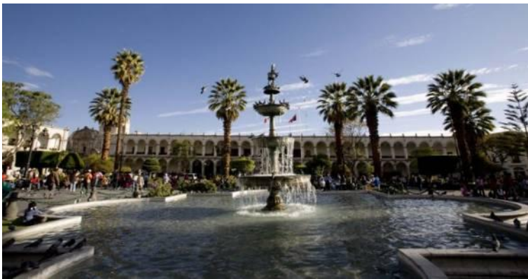
Plaza de Armas