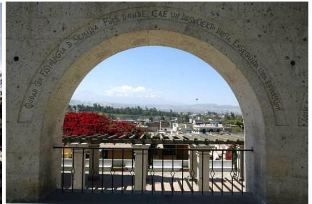
Portadores de Yanahuara

Der Nachmittag steht Ihnen zur freien Verfügung. Genießen Sie die Stadt auf eigene Faust oder gehen Sie in einem der wunderbaren peruanischen Restaurants essen. Arequipa ist für seine gute Küche bekannt.