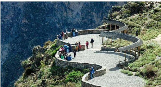
Aussichtsplattform am Cruz del Condor

Am Morgen fahren Sie in die berühmte Colca Schlucht. Die Colca-Schlucht ist doppelt so tief wie der Grand Canyon. Unweit findet man die Cotahuasi-Schlucht, welche die Tiefste der Welt ist. Die Colca-Schlucht erreicht eine Tiefe von 3.180 Metern und stellt eine absolut sehenswerte Naturscheinung dar.