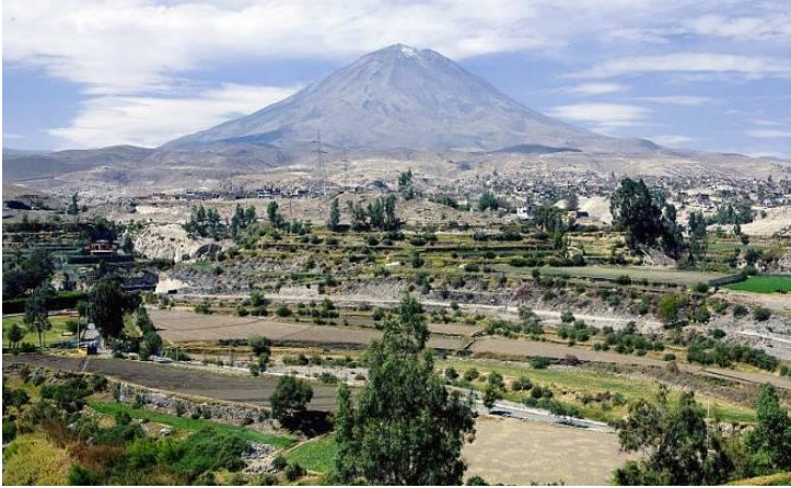
Arequipa und sein Vulkan Misti

Nach dem Frühstück fahren Sie im Minibus nach Chivay. Die Entfernung beträgt ca. 142 km (Fahrzeit ca. 3 Stunden). Sie fahren über Ebenen von denen Sie tolle Ausblicke auf die Vulkane Misti (5.825 m) und Chachani (6.075 m) haben. Unterwegs überqueren Sie den Patapampa-Pass und erreichen eine Höhe von 4.910 m. Hier machen Sie einen kleinen Stopp, am „Mirador de los Andes“, und haben einen Ausblick auf vier weitere Vulkane. In Chivay angekommen, genießen Sie erst einmal ein leckeres Mittagessen. Danach können Sie das Thermalbad „Termas de la Calera“ am Nachmittag besuchen (optional).